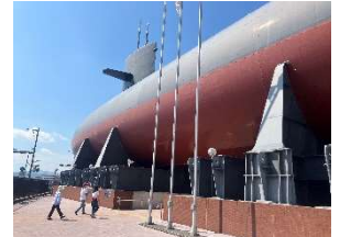
「てつのくじら館」人が小さい・・・

中学校生活の中でも大きな行事の一つである3年生の修学旅行に行ってきました。9月17日～19日に2泊3日の行程で、広島、宮島、萩を回ってきました。広島では呉市の「てつのくじら館」「大和ミュージアムサテライト」と広島市の平和公園、原爆資料館を見学しました。「てつのくじら館」では潜水艦の大きさに圧倒されましたが、艦内の居住空間はとても狭かったです。「大和ミュージアムサテライト」では戦艦大和建造の技術がその後の平和な社会において生かされていることを知りました。平和公園にある原爆資料館では原爆の悲惨さを目の当たりにしました。一発の爆弾で何万人もの人が亡くなるという惨劇を二度と繰り返してはならないと思いました。3年生も真剣に資料に見入っていました。2日目は宮島で自主研修を行いました。それぞれのグループが思い思いの計画を立て、宮島での学びを深めました。3日目は萩から秋吉台の秋芳洞へと向かいました。ホテルの裏が日本海でしたので、日本海に浸る人もいました。秋芳洞では鍾乳石のスケールの大きさに圧倒されました。気温は17℃程度ということで、涼しい中、自然の造形美の美しさを見ることができました。2日目に少し雨に降られましたが、概ね好天に恵まれた修学旅行となりました。この3日間のために、実行委員の皆さんは準備から運営まで大変だったことと思います。また、3年生それぞれが役割を分担することで、旅行がスムーズに進みました。皆さんありがとうございました。この修学旅行の思い出はきっと一生心に残るものになると思います。平和について考えたこと、友達との絆を深めたこと、様々な思いを胸に、あと半年ほどの中学校生活を頑張りましょう！