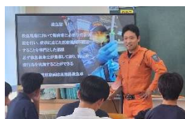
消防士の方の講話